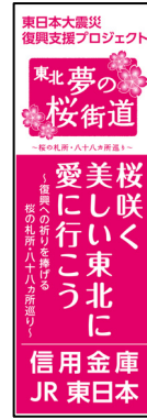
「東北・夢の桜街道」ののぼり旗(桜の札所や最寄駅に1,000本設置)

の間、全店舗(6,382店)に掲示し、信金のネットワークの力で「東北・夢の桜街道」をPRした。